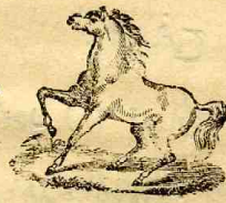
معرض الخيل في القدس